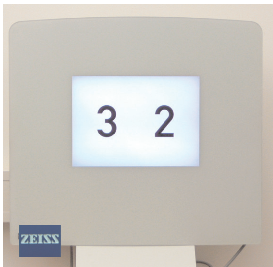
Sehtestgerät "Zeiss Polatest E II"